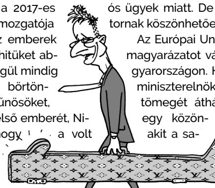
Illusztráció: Pápai Gábor – Népszava

Az Európai Unió és a civilizált világ magyarázatot vár arra, mi folyik Magyarországon. Hogyan teheti meg a miniszterelnök, hogy jogszabályok tömegét áthágva menedéket ad egy közönséges bűnözőnek, akit a saját népe éppen a törvénytelen tettei miatt zavart el a hatalomból.