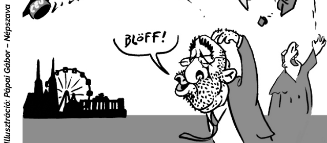
Illusztráció: Pápai Gábor – Népszava