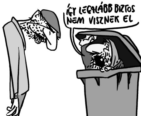
Illusztráció: Pápai Gábor – Népszava