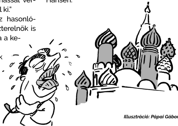
Illusztráció: Pápai Gábor

„Magyarországon arra használják az (újságok) felületeit, hogy az idegengyűlöletet szítsák. Amelyből aztán nem egykönnyen lehet kigyógyítani a társadalmat” – fogalmazott a lapnak Hendrik Hansen.