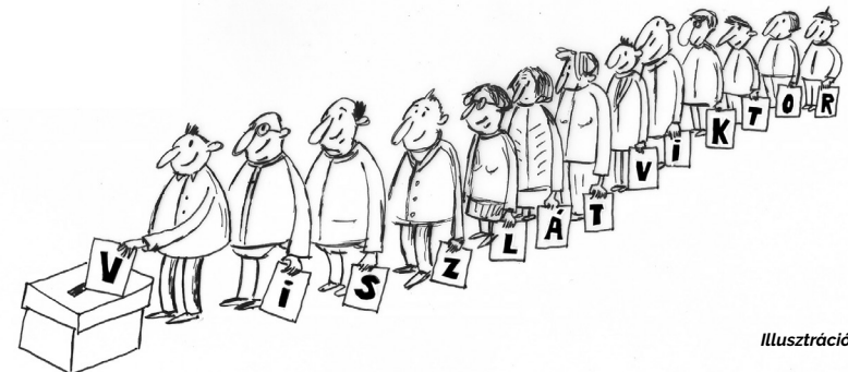
Illusztráció: Pikler Éva

Ami most a legfontosabb, hogy legyen rendszerváltás, ezt pedig a minél