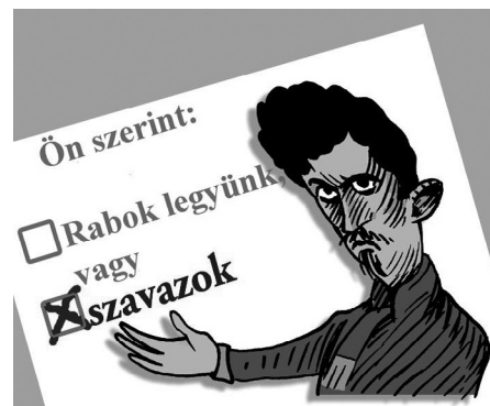
Illusztráció: Pápai Gábor – Népszava

Minden eddiginél többen kell szavoznunk az áprilisi választáson, de sokan kellünk ahhoz is, hogy elmagyarazzuk mindenkinek, mi az a taktikai szavazás, és megismertessük a legesélyesebb ellenzéki jelölteket.