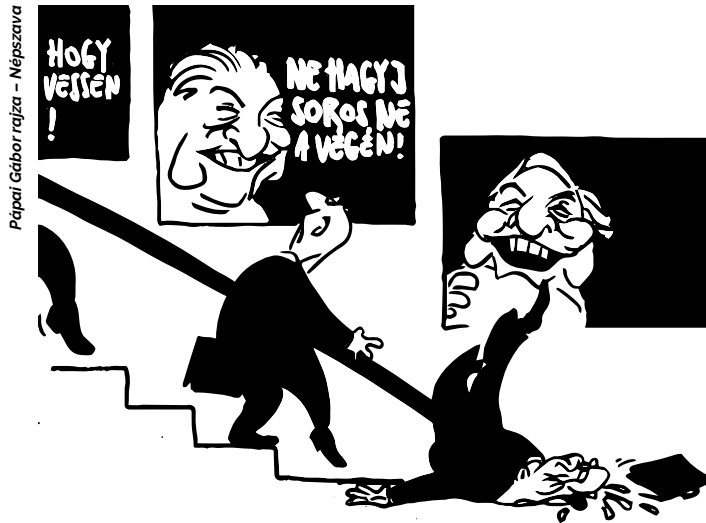
Pápai Gábor rajza – Nepszava

A kormány azt szeretné elhitetni önökkel, hogy én a magyar nép ellensége vagyok. Semmi sem áll távolabb ettől a hamis állítástól.